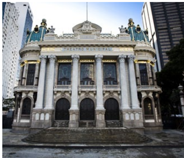
Inaugurado em 1909, o Theatro Municipal é um dos principais símbolos das mudanças que ocorreram no Rio de Janeiro no início do século 20.

No seu entorno, foram construídos muitos edifícios luxuosos também inspirados em modelos europeus: como o Theatro Municipal, o Museu de Belas Artes e a Biblioteca Nacional.