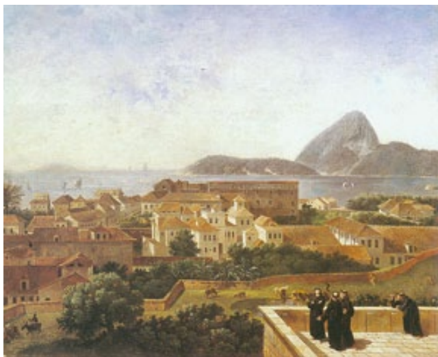
Vista do Morro de Santo Antônio, em 1816. Nicolas-Antoine Taunay (1755-1830). Museu Nacional de Belas Artes, Rio de Janeiro.