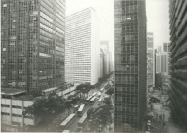
A Avenida Central foi inaugurada em 1905, como a mais “bela avenida da cidade do Rio de Janeiro”. Em 1912, ela foi rebatizada como Rio Branco, seu nome atual.