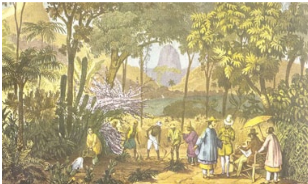
Gravura de Juan Moriz Rugendas mostra as plantação de chá no Jardim Botânico do Rio de Janeiro, em 1835.

Um dos mais importantes legados da presença da família real portuguesa é o Jardim Botânico, fundado em 1809. Com 202 anos, ele não nasceu como área de lazer, seu uso atual. Também não foi o primeiro do Brasil, junto com ele, foram criados outros cinco: em Belém, Olinda, Vila Rica, Salvador e São Paulo. Mas por que dom João VI quis criar Jardins Botânicos em um paraíso tropical? O objetivo desses santuários ecológicos era aclimatar plantas exóticas das Índias Orientais.