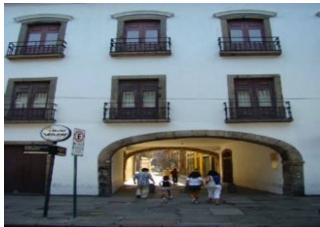
Arco dos Teles.

Erguido no século 18, quando Francisco Teles de Menezes, juiz dos Órfãos, encomendou ao brigadeiro Alpoim a construção do casario que ligava o Largo do Carmo (atual Praça XV) à Rua da Cruz (atual Rua do Ouvidor). O Arco hoje está localizado sob os prédios de números: 32 e 34 e em seu entorno está repleto de bares e restaurantes.