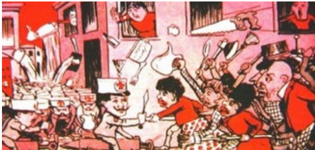
Charge da Revolta da Vacina com o médico Oswaldo Cruz no centro. Disponível: http://historica.com.br/hoje-na-historia/revolta-da-vacina-no-rio-de-janeiro . Consulta em: 12/10/2011.

Preocupado com a imagem internacional que a capital brasileira ofereceria aos investidores estrangeiros e com as condições sanitárias da cidade, sempre atingida por epidemias de dengue, tuberculose, tifo, mas especialmente de febre amarela e varíola, o governo republicano decidiu realizar uma reforma na capital em três frentes: modernização do porto, reforma urbana e saneamento. Além disso, foram realizadas campanhas contra as doenças que afetavam constantemente a população urbana.